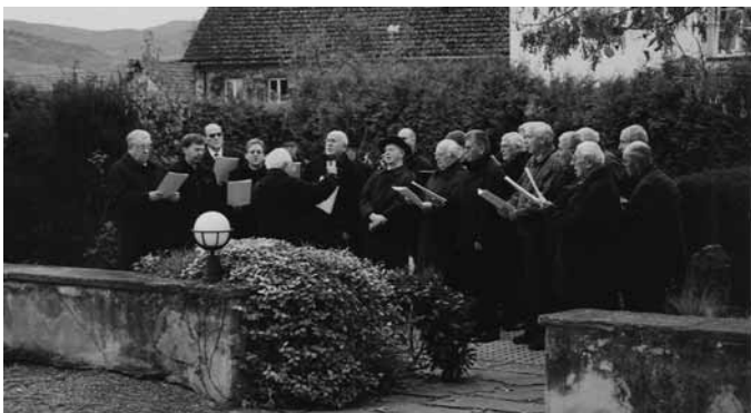
Männergesangsverein Heitersheim am Volkstrauertag in Gallenweiler

„Sorgt ihr, die ihr noch im Leben steht, dass Frieden bleibe, Frieden zwischen den Menschen, Frieden zwischen den Völkern.“