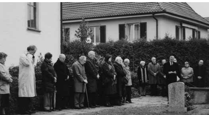
Gedenken an den Volkstrauertag in Gallenweiler