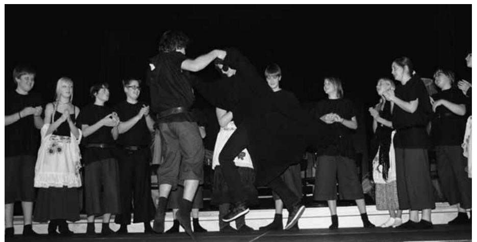
Bericht aus der Badischen Zeitung.