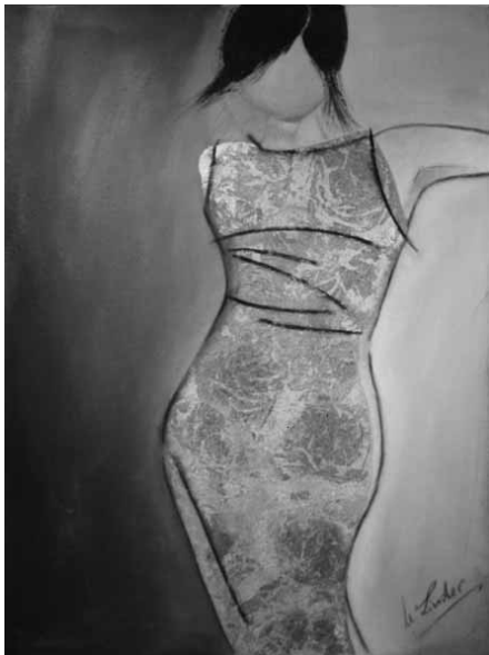
2004 hat die 58-jährige Uschi Linder aus Heitersheim die bildende Kunst für sich entdeckt.

In Privatstunden und Workshops perfektionieren sie ihre Malerei. Mittlerweile kann sie bereits auf 17 Ausstellungen verweisen. „Malerei bedeutet für mich das Abtauchen in eine andere Welt, in die ich mich gerne zurückziehe“, sagt sie. Ihre Bilder gestaltet sie mit Öl- oder Acrylfarben, Kreide und in Spachteltechnik. Bis Mitte Januar 2011 zeigt Uschi Linder im Galeriebereich des Friseursalons Brendle in Heitersheim einige Werke wie „First Lady“, „Skyline“ (Foto) und „Anlage Gold“.