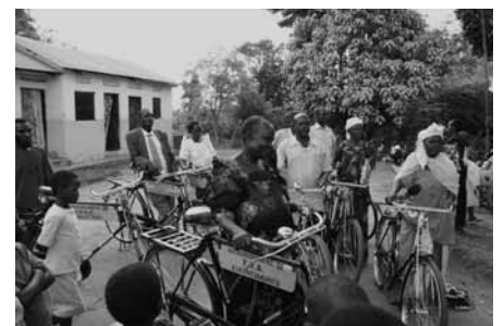
Traditionelle Hebammen erhalten Fahrräder, August 2010

Im Moment sind noch ein paar Plätze frei, bei Interesse bitte baldmöglichst melden.