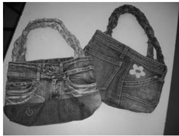
Jeanstasche selbst genäht

Mit der Schaffung der Stelle des Jugendreferats gab es dieses Jahr erstmals die Möglichkeit auch für Jugendliche ab 12 Jahren ein Ferienprogramm anzubieten. Der "Testlauf" war sehr erfolgreich und hat allen Beteiligten, d.h. den TeilnehmerInnen, den Durchführenden der Veranstaltungen sowie der Planerin viel Spaß gemacht!! An dieser Stelle ein herzliches Dankeschön allen Helferinnen und Helfern, die zum Gelingen der einzelnen Aktionen beigetragen haben! Außerdem vielen Dank an die Grund- und Hauptschule, der Feuerwehr sowie dem Bürgerverein Gallenweiler, die uns ihre Räumlichkeiten zur Verfügung gestellt haben! Angeboten waren 8 verschiedene Veranstaltungen mit 98 freien Plätzen. 90 Anmeldungen zeigten dabei die gute Resonanz bei den Jugendlichen. Erfreulich war die ausgewogene Beteiligung von Mädchen und Jungen, die im Alter von 10 bis 15 Jahren waren. Der absolute Renner war das Angebot "Cocktails mixen, alkoholfrei" mit 20 Anmeldungen bei 12 geplanten Plätzen! Mit einem zusätzlich angebotenen Termin konnten wir diesen Ansturm aber gut bewältigen. Die Aktion "Floßbau" musste wegen des Rhein-Hochwassers leider ersatzlos gestrichen werden. Mit einigen Impressionen aus den Veranstaltungen wünschen wir allen TeilnehmerInnen des JugendFerienProgramms ein gutes neues Schuljahr! Bis zum nächsten Jahr!