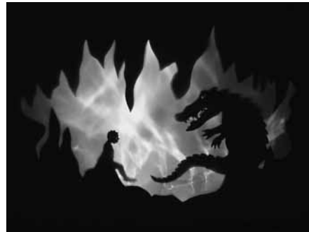
Szene aus dem „Zauberkrokodil“.

Mehr Informationen unter www.kinderclub-gallenweiler.jimdo.com