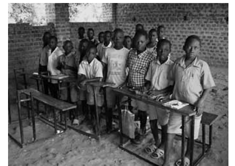
Schüler der Okunguro Primarschule in Ostuganda.