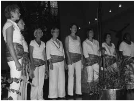
Der African Gospelchor wird den Gottesdienst musikalisch begleiten