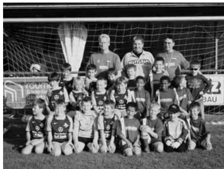
Auf dem Bild die beiden Mannschaften aus Denzlingen und Heitersheim

und der ein Jahr ältere Jahrgang aus Denzlingen hatte noch die Luft für die Endphase.