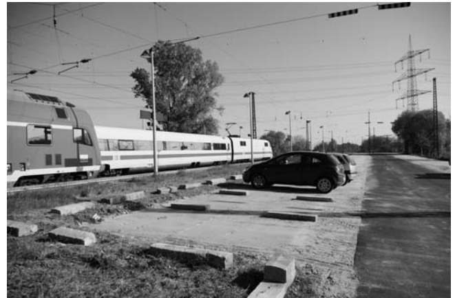
Noch halten keine ICEs in Heitersheim, aber alle Personenzüge zwischen Offenburg und Basel. Für die 1800 Einstiege täglich stellt die Stadt jetzt 366 kostenlose Park-and-Ride-Plätze zur Verfügung. SABINE MODEL

Als Kleinzentrum im Sulzbachtal bietet Heitersheim attraktive ÖPNV-Verbindungen an. Die werden gerne von angrenzenden Regionen genutzt, weil außer dem ICE alle Personenzüge zwischen Offenburg und Basel halten. Busanbindungen sind ebenfalls gut ausgebaut und Räder überdacht sowie per Videokamera überwacht unterzustellen. Für Autos standen bis dato 246 Parkplätze zur Verfügung. Da die bei täglich 1800 Einstiegen mit steigender Tendenz nicht mehr ausreichten, wurden jetzt weitere 120 Stellplätze neu eingerichtet. Dazu hat die Stadt von der Bahn AG die ehemalige Laderampe angepachtet, aufgeräumt und die Böschungen begrünt, berichtet Stadtbaumeister Martin Gekeler. Die mittige Zufahrt ist asphaltiert, die Stellplätze links und rechts sind ökologisch sinnvoll mit einer Schottertragschicht unterbaut und mit einer Granitforstmischung ausgestattet. So kann das Regenwasser zu hundert Prozent versickern. Als Abgrenzungen zur Böschung und zu den Gleisen wurden Barrieren aus Stein und Holz verlegt. Sogar an Parkplätze für Menschen mit Behinderungen ist gedacht. Das Angebot für den Gesamtauftrag lag bei 38000 Euro. „Wir werden diese Summe jedoch nicht brauchen“, versichert Gekeler. Ab sofort können die meist eiligen Autofahrer nun wieder bequem eine Parkmöglichkeit finden, freut sich Bürgermeister Jürgen Ehret, und sogar in die unmittelbare Nähe der Gleise fahren.