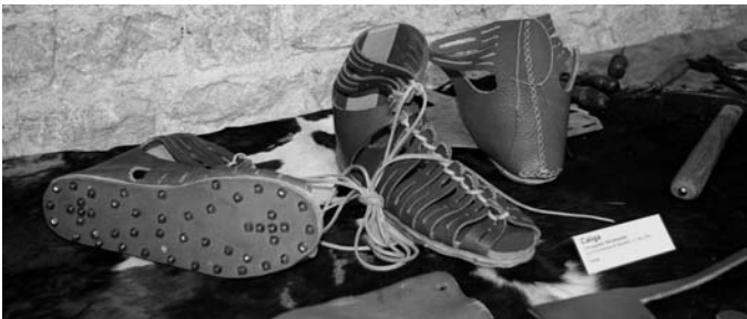
Die Arbeit in einer römischen Schusterwerkstatt kann man am Pfingstmontag im Römermuseum in Heitersheim erleben.