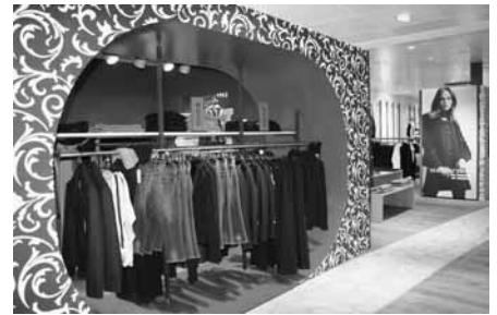
Die verschiedenen Mode-Marken angemessen und ansprechend zu präsentieren, ist Ziel der neuen Geschäftsstruktur.