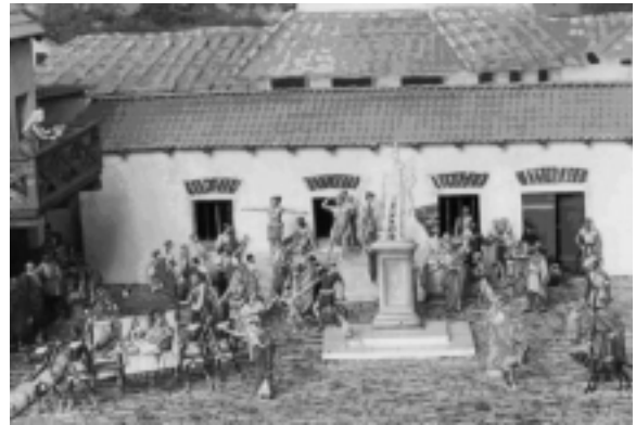
Darstellung römischen Lebens in Dioramen und Aufstellungen