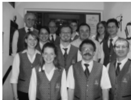
Die neu gewählte Vorstandschaft des Musikvereins