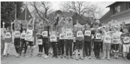
Vorfreude bei den Jüngsten vor dem Start

Insgesamt kann sich der Verein über prima Ergebnisse mit einigen Podestplätzen freuen. Herzlichen Glückwunsch!