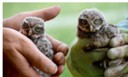
Zwei der Gallenweiler Steinkauznestlinge, frisch beringt

(Dr. Helmut Mett, Administrator Steinkauz im Nabu Müllheim)