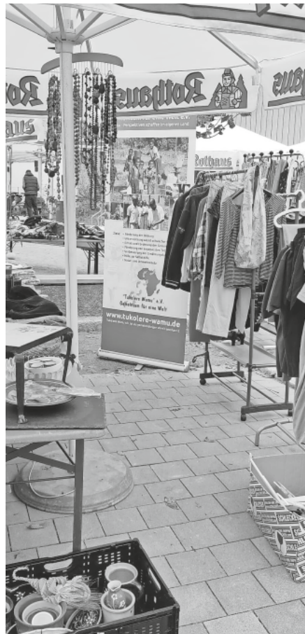
Bilder der Veranstaltung, Info zu den Projekten und Kontodaten auf www.tukolere-wamu.de . Kontakt: vorstand@tukolere-wamu.de