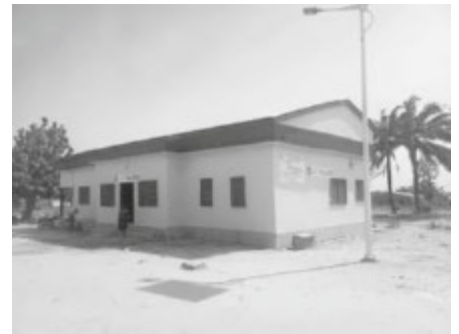
Die Krankenstation in Salimde konnte komplett renoviert werden.

Als nächstes steht die Klonou Krankenstation (in der Nähe von Kpalimé, im Südwesten des Landes) an. Wir konnten sie im November selber besuchen. Das Dach ist undicht, Wände und Einrichtung haben darunter gelitten. Die Kosten für die Sanierung betragen ebenfalls ca. 6.500,00 Euro. Jede Unterstützung ist herzlich willkommen.