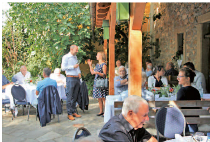
beim Chilbi-Stammtisch im Garten der Krone