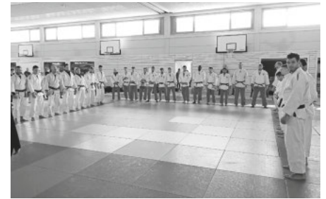
in roten Hosen, die Heitersheimer Judomannschaft

einandersetzung von Seiten der Gastgeber verloren, dennoch sammelte der Eine oder Andere wertvolle Erfahrung für seine noch kommende Kämpfe.