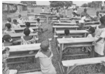
Diese Schulbänke wurden bereits finanziert, weitere sollen gezimmert werden.

Wir konnten schon einige Projekte mit dem Erlös des Flohmarkts in Afrika umsetzen, unter anderem finanzierten wir Hygienemaßnahmen an Schulen in Togo. Nun geht der Flohmarkt zu Ende und am Samstag 09.10. findet von 09.00 bis 13.00 Uhr ein Flohmarkt- Ausverkauf statt. Es sind noch tolle Schnäppchen vorhanden, gerne vorbeischaun. Die letzte Etappe des Flohmarktes soll für Schulbänke am Gymnasium in Koma, Sokodé sein. Für je 35,00 Euro kann eine Schulbank für 2 Schüler vor Ort gezimmert werden. Wir freuen uns auf sehr viele Schnäppchenjäger!