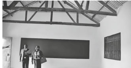
Ein neues Klassenzimmer an der Madrasa Primarschule in Nakaloke

möglich und überall herrschte Freude und auch Hoffnung, dass Begegnungen, wenn auch mit Abstand, wieder möglich waren. Wir konnten gleich zwei Einweihungen von Klassenzimmern, die von Tukolere Wamu finanziert wurden, beiwohnen. Mit dabei auch Vertreter der Regierung die sich sehr erfreut zeigten über die nun besseren Unterrichtsbedingungen.