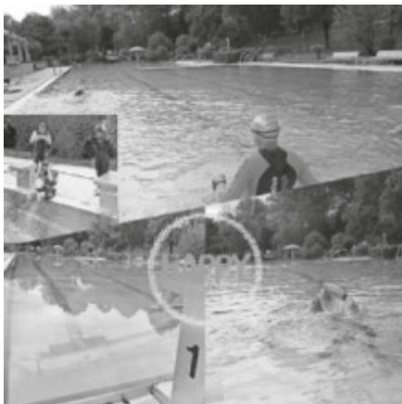
Schwimmen der Aktiven am 17.05. in Kippenheim bei ca. 14° Wassertemperatur

Aber nach dem kältesten April seit 40 Jahren und dem aktuell über uns liegenden Jetstream, der kalte Luftmassen zu uns drückt, ist das Schwimmen schon fast mit Eisbaden zu vergleichen.