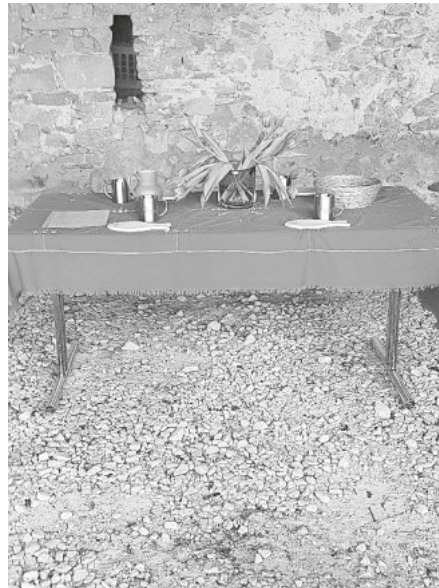
Osterweg „Ostern ERlebt“

Die Bilder vom Osterweg in Heitersheim können Sie auf unserer Homepage finden! Danke dem Photographen Michael Vierneisel!