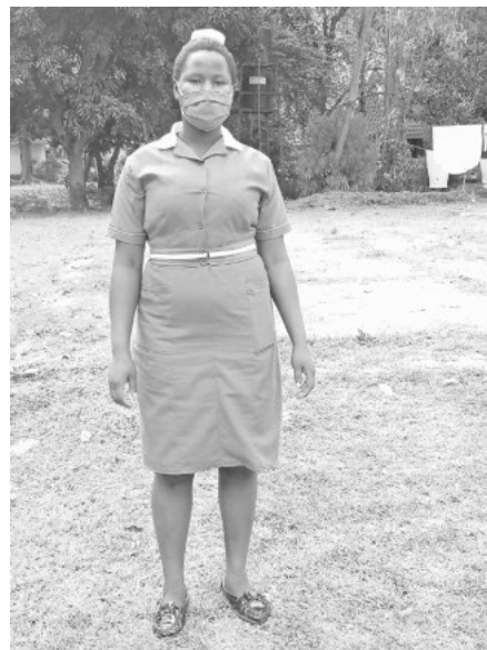
Diese junge Frau kann Dank eines Heitersheimer Sponsors ihre Ausbildung zur Krankenschwester machen

Die jungen Menschen, für die ein Patenschaftsantrag gestellt wurde, haben oft z.B. durch Krankheit oder Tod der Eltern heftige Schicksalsschläge in ihren Familien erfahren. Sie leben meist in absoluter Armut und haben nur durch eine Patenschaft eine Chance auf Bildung.